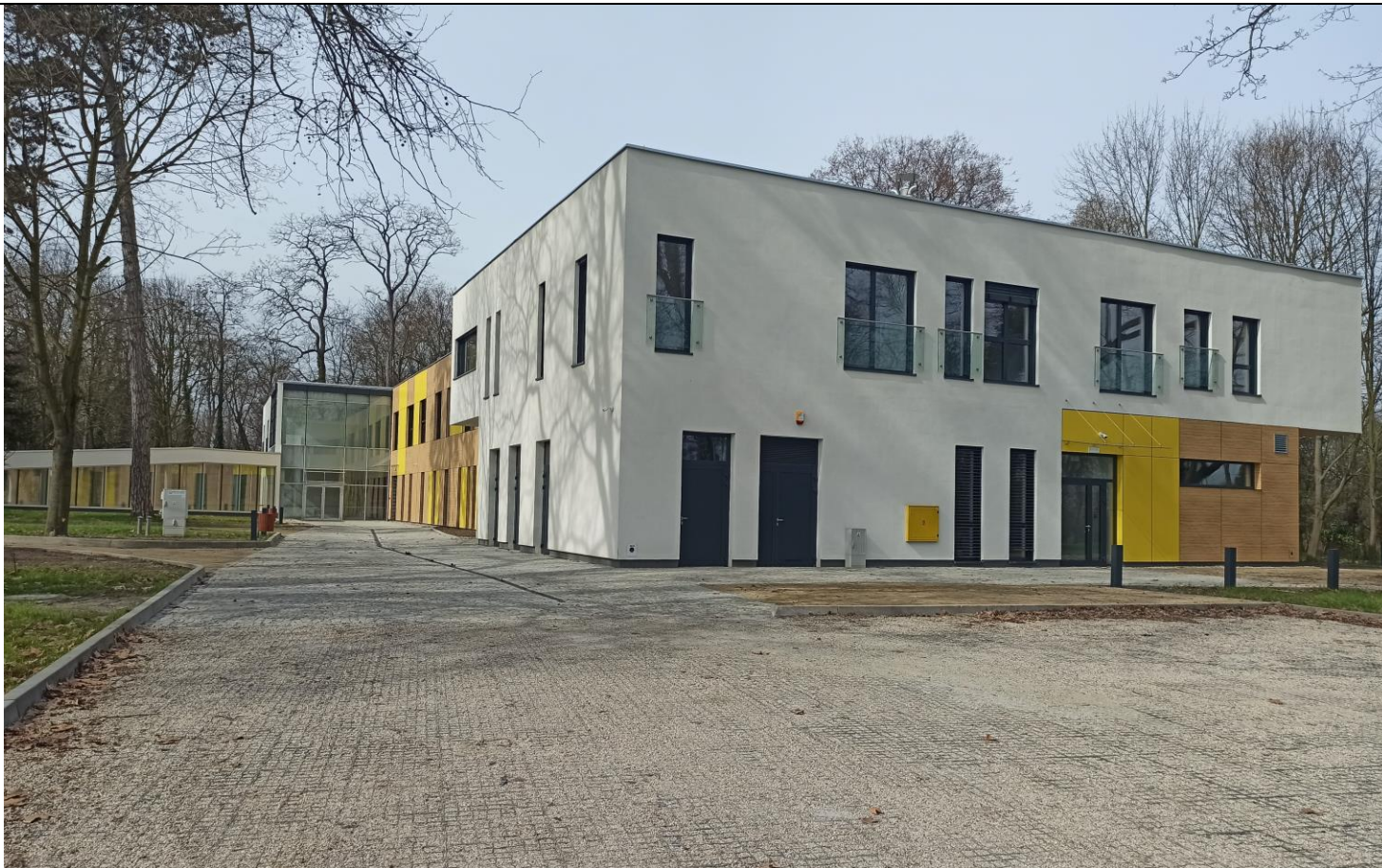
Nowy budynek Oddziału Lecznico-Rehabilitacyjnego w Grębanie

W 2023 roku Powiat Kępiński poczynił starania o pozyskanie kolejnych środków umożliwiających zakup wyposażenia do nowego obiektu oraz