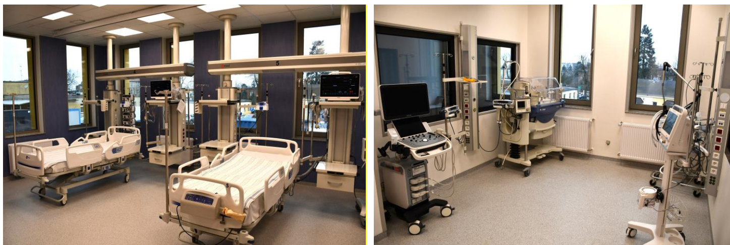
Oddział anestezjologii i intensywnej terapii i oddział noworodkowy po przebudowie

W 2023 roku dobiegła końca realizacja przebudowy: Oddziału Anestezjologii i Intensywnej Terapii, Oddziału Noworodkowego oraz Oddziału Położniczo-Ginekologicznego wraz z traktem porodowym SPZOZ w Kępnie. Realizacja zadania dofinansowana została ze środków Rządowego Funduszu Inwestycji Lokalnych w kwocie 5 500 000 złotych. Realizację zadania w całości powierzono SPZOZ w Kępnie.